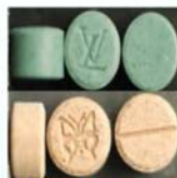
MDMA、MDA、PMMA 等安非他命類毒品