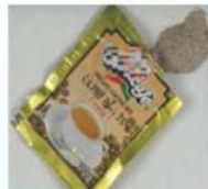
Mephedrone (喵喵)、 bk-MDMA、MDPV (浴鹽) 等安非他命類毒品